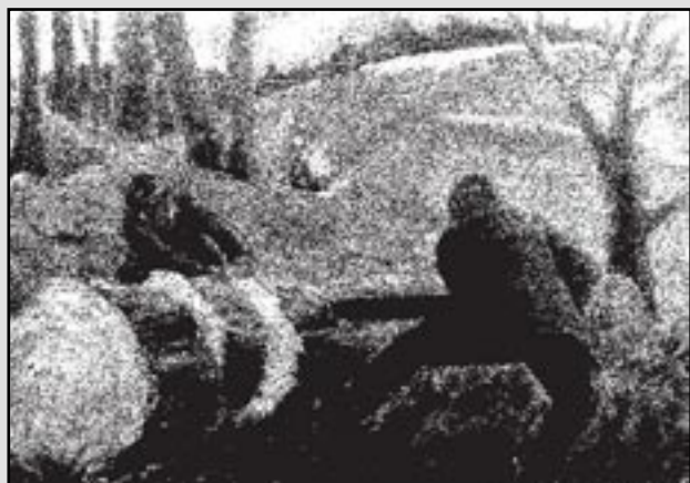
Jaroslav FRYDRYCH - TVÁŘE A KRAJINA výstava obrazů

INFORMACE : B. PAVLIŠKA TEL. 556 850 369 MOB. 731 151 173 R. STIBOR MOB. 605 106 259