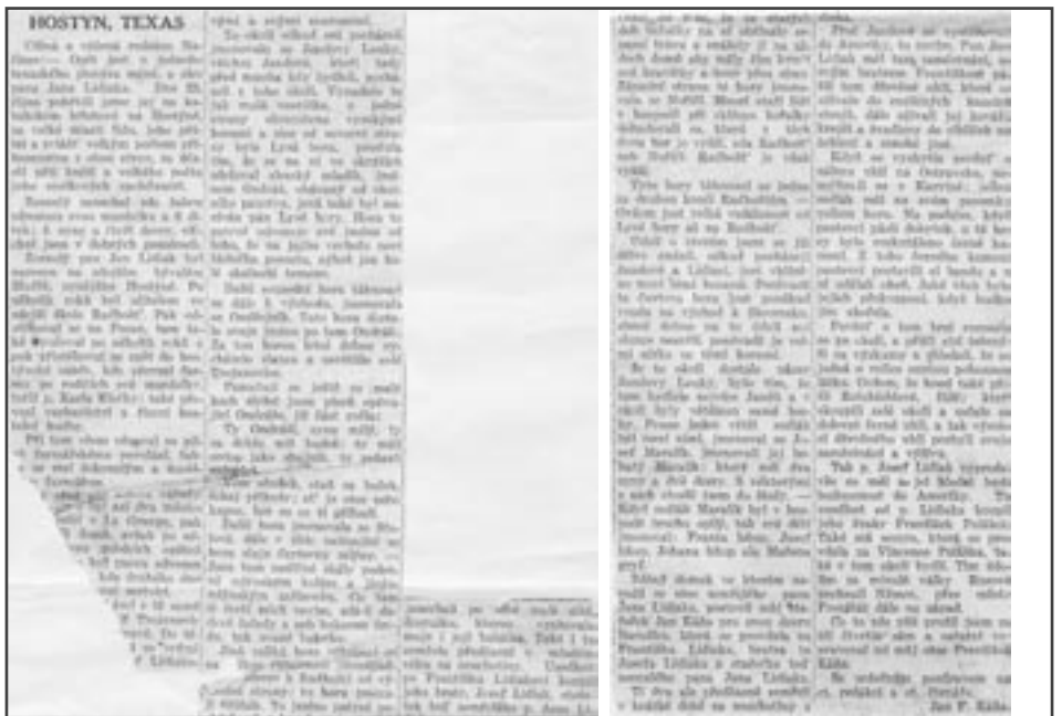
Kopie ústřížku z krajanových novin Našinec