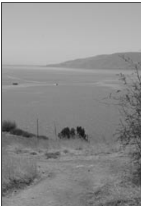
Pohled na Jam Kineret z tzv. Hory blahoslavenství

Tu usedá na zábradlí kousek vedle nás tiše - jako nějaký soumravný duch - kvakoš noční ( Nycticorax nycticorax ). Tento druh volavky patří k elegantním ptákům. Na břichu světlešedý, svrchu černý s rubínovými očima. V období toku jsou nápadná dlouhá bílá pera na temeni. Vyhledává mělké břehy jezer nebo mokřadů, kde za soumraku nebo v noci loví ryby či obojživelníky, případně hmyz. Přes den se skrývá v rákosinách a břežním porostu. S výjimkou Antarktidy a australské oblasti je celosvětově rozšířený, dává však přednost teplejším regionům, takže na severu Evropy, Asie a Ameriky ho prakticky nenajdeme. V ČR pobývá sezónně (od dubna do září), ale ve Středozeří očividně není problém ho zahlédnout i v podzimních měsících.