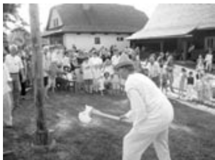
Opět PŘEKVAPENÍ !!!

Vystoupí Valašský soubor Radhošť a děti z mateřské školy. Občerstvení: guláš, lopat'áky, pivo.