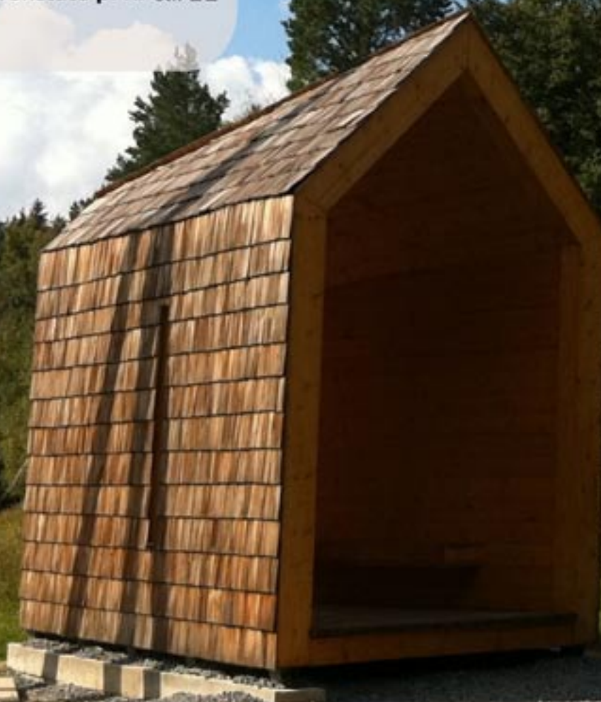
Zvonička Strážkyně Beskyd