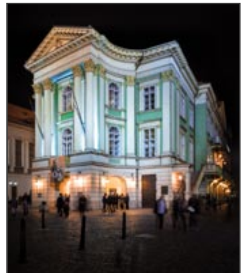
Stavovské divadlo v Praze