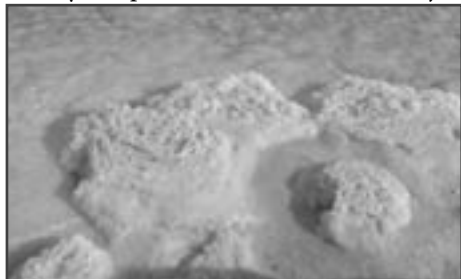
Solné útvary na břehu Mrtvého moře

Máme za sebou celodenní putování podél Mrtvého moře. Je to vlastně spíš slané bezodtoké jezero. Pozoruhodné na něm je kromě jeho extrémně vysoké salinity (33,7% - což odpovídá tomu, jako byste v jednom litru vody rozpustili více než 330 gramů soli) rovněž extrémně nízká poloha (nachází se 420 m pod hladinou světového oceánu). Není divu, že tak zvláštní místo je opředeno mýty a pověstmi. Podle tradice tu kdysi stála města Sodoma a Gomora, která Hospodin pro rozmařilost jejich obyvatel potrestal. Spálil je ohněm a sírou padající z nebe. Tak to aspoň popisuje bible v Gn 19. Jen Lot se svými blízkými byl zachráněn. Jeho žena, která se ve zvědavosti při útěku obrátila, aby viděla, co se děje, se proměnila v solný sloup. Dodnes se to místo ukazuje.