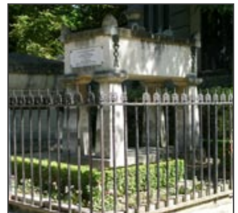
Moliérův hrob na pařížském hřbitově Père Lachaise