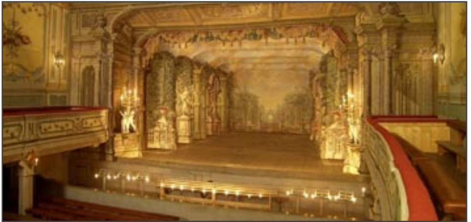
Barokní divadlo v Českém Krumlově

Ačkoliv máme pocit, že klasicismus následuje po baroku, není tomu tak. Klasicismus existuje současně s barokem, ovšem na rozdíl od baroka pak přechází do 18. st., a na klasicismus volně navazuje osvícenství. Toto vymezení je potřeba si uvědomit, abychom předešli následným diskuzím. V Evropě (především v Itálii) se totiž během období baroka (a klasicismu) vyvinulo nové divadelní jeviště – takové, jaké známe dodnes. Dostalo název barokní neboli kukátkové jeviště a to z toho důvodu, že se díváme na divadlo pouze z jednoho úhlu, jakoby kukátkem. Je vybaveno portálem, několika oponami, postranními šálami a vrchními sufity (látky visící ze stropu), propadla (a to tak velká, že se do podzemí třeba propadl i celý dům) a třeba i budkou pro nápovědu. Během představení bylo užíváno spousta efektů – iluze hromu, moře, atd. Výrazným posunem dopředu bylo i nové využití světelných zdrojů, které vymyslel architekt Joseph Furtenbach. Umístil světlo za vrchní sufity, za scénu i předscénu, na boky portálu. Vyměnil svíce za olejové lampy a pomocí odrazových sklíček pak směřoval proud světla tam, kam potřeboval nebo měnil na jevišti barvu. Stejnou změnou si prošla scénografie – byly vytvořeny nádherné, barevné a hlavně reálné kulisy (například rozkvetlá ulice), před kterými se odehrávaly veškeré scény. Tyto kulisy byly na pohled nádherné, ovšem poněkud mělké a tudíž nedovolovaly patričnou jevištní