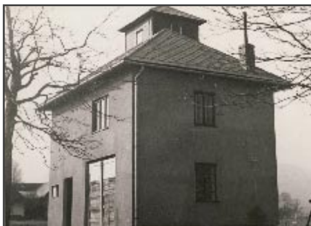
Hasičská zbrojnice v r. 1948