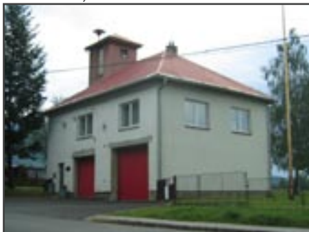
Hasičská zbrojnice v r. 2006 a v r. 2013 (dole)