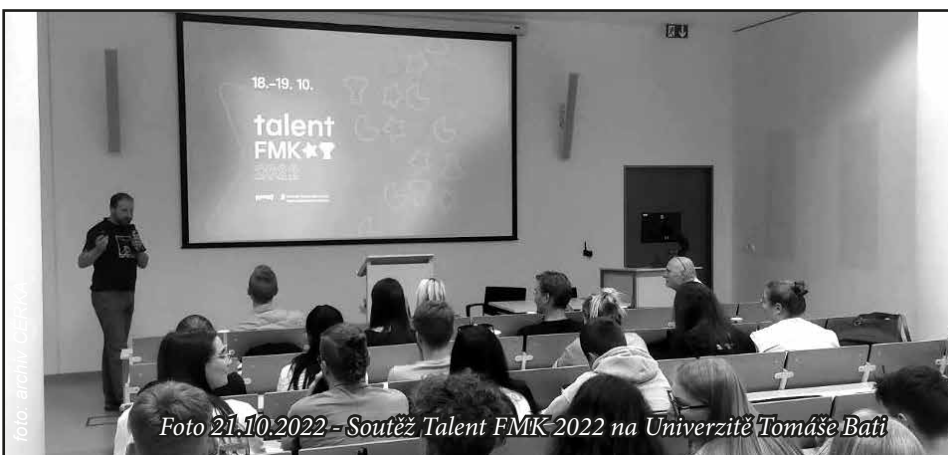
Foto 21.10.2022 - Soutěž Talent FMK-2022 na Univerzitě Tomáše Bati